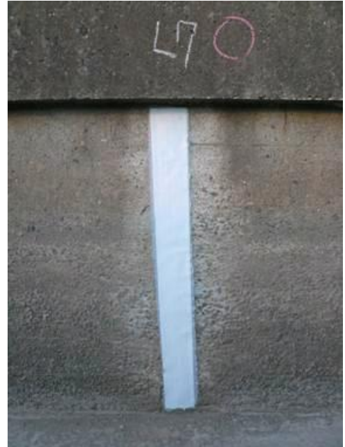
水路のひび割れ補修