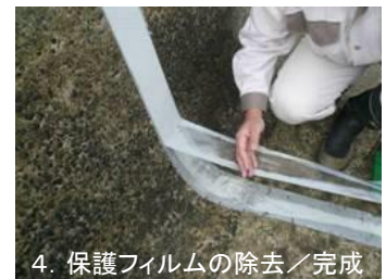
4. 保護フィルムの除去/完成

▼ショーボンドHBが硬化した後(約1日後)、HBテープの保護フィルムを剥がします。