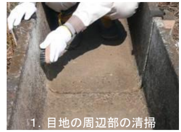
1. 目地の周辺部の清掃